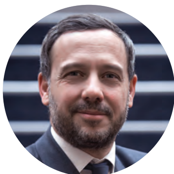
ADRIEN TAQUET Secrétaire d'État

Cette stratégie sera également un lieu de dialogue entre l'Etat et les départements. À rebours d'une vision rigide et datée des enjeux de répartition des compétences (et donc des financements), mon souhait est que nous puissions, de manière pragmatique, améliorer les pratiques et les modes de faire, pas à pas et de manière concrète, sur des sujets aussi essentiels que les délais d'exécution des mesures de justice, les déplacements multiples que subissent certains enfants, le suivi en santé, les impasses de la prise en charge du handicap et de la santé mentale en protection de l'enfance.